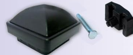
Sigurnosni spojni elementi sa ravnim vijkom