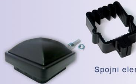
Spojni elementi za tri pravca