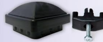
Spojni elementi za duplo nastavljnje

Svi elementi su prilagođeni kvadratnim stubovima 50x50x2 mm.